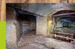
interiér štôľne Zuzana