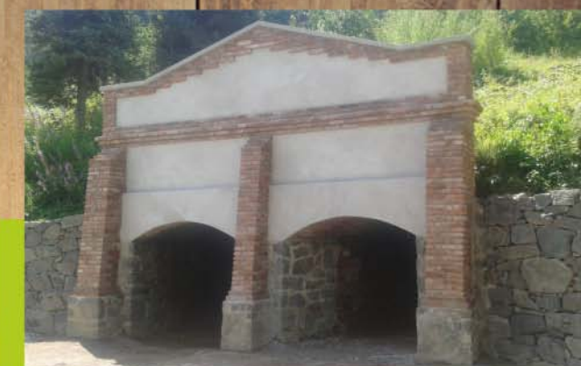
Finálny stav po obnove 2018