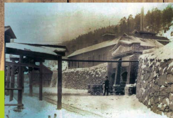
Dobová fotografia cca 1895

Štôľňa a šachta Zuzana patrí k najdôležitejším technickým pamiatkam po banskej činnosti v Žakarovciach z obdobia najväčšieho rozmachu baníctva z prelomu 19.-20. storočia. Bola postavená na významnom ložisku železnej rudy na Spiši na tzv. Hrubej žakarovsko-klippbergskej žile. Svojou rudnou bazou bola surovinovou základňou hutníckeho priemyslu v širokom okolí. Bola vybudovaná ako dopravná štôľňa - šachta pre presun rudy z bane do úpravárenskej časti závodu. Úpravárenský závod na spracovanie rudy bol v Mária Hute, a preto v roku 1884 bola vybudovaná prvá priemyselná ozubnicová železnica na území bývalého Uhorska, ktorá spájala Mária Hutu a šachtu Zuzanu. Štôľňa bola po vyrazení po celej dĺžke vymurovaná, steny z kameňa a strop-valená tehlová klenba. Dĺžka cca 185 m. Na konci je ochoz a šachta výtahu pre dopravu rudy v banských vozíkoch. Strojovňa výtahu bola taktiež umiestnená v podzemí a dalo sa k nej dostať chodbou z hlavnej štôľni. Portál Zuzany bol zrealizovaný ako replika podľa dobovej fotografie v roku 2018.